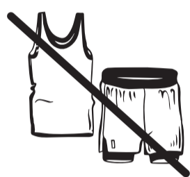
Красота и удобство

Наши рецепторы воспринимают только пять основных вкусов, за остальное отвечает обоняние. Косметика и парфюм с резким ароматом может исказить впечатления от блюд как у вас, так и у других гостей. Пожалуйста, откажитесь от их использования.