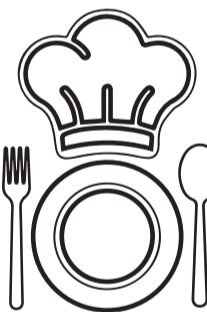
Придерживайтесь рекомендаций шефа

Мы будем очень рады, если вы сфотографируете блюда и поделитесь своими впечатлениями об ужине в сети. Единственное, отключите звуковые эффекты и вспышку, чтобы не отвлекать других гостей от нового вкусового опыта.