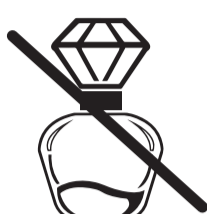
Аромат влияет на вкус

Пунктуальность – это об уважении. Каждый ужин – это путешествие, которое гости начинают и заканчивают вместе. Мы подаем блюда одновременно, плавно переходя от одного курса к другому. Чтобы не задерживать остальных, просим приходить в ресторан максимум за 10 минут до начала ужина.